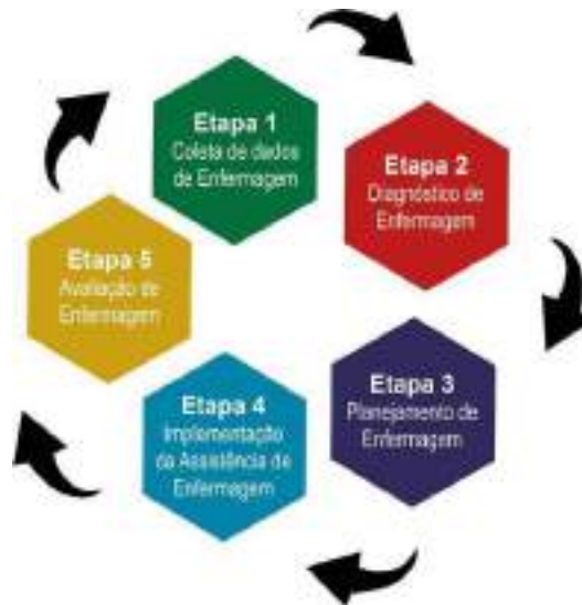
Imagem 3: Protocolo SAE