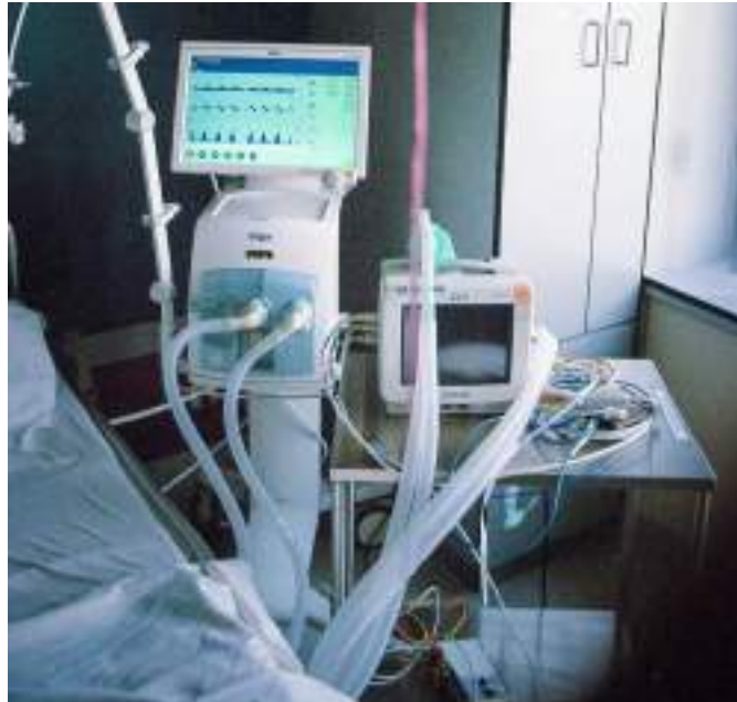
Imagem 4: UTI – Unidades de Terapia Intensiva

intervenções médicas imediatas. Nela, profissionais de saúde, como enfermeiros e médicos, estão disponíveis 24 horas por dia, utilizando equipamentos sofisticados para garantir estabilidade e recuperação (Oliveira et al., 2019).