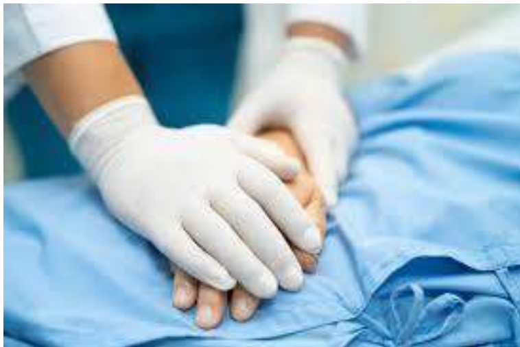
Imagem 2: Acolhimento paciente crítico

A humanização da assistência inicia-se logo na recepção dos serviços de saúde, onde o acolhimento na unidade propicia uma maior aproximação entre os pacientes e os profissionais. Essa interação ajuda a fortalecer as relações interpessoais e a criar vínculos de confiança, promovendo um ambiente seguro. Como resultado, isso contribui para a integralidade e a continuidade do cuidado prestado aos usuários. Esse processo de acolhimento vai além da simples recepção; envolve a escuta ativa, a empatia e o entendimento das necessidades e expectativas dos pacientes. A inclusão do usuário como protagonista do seu próprio cuidado é essencial para que se sintam valorizados e respeitados em sua singularidade. Dessa forma, a humanização se estabelece como um eixo central nas práticas de saúde, onde o reconhecimento da dor, do sofrimento e das experiências de vida dos indivíduos é fundamental para a construção de um atendimento de qualidade (Dato, Lima, Spolidoro, 2019).