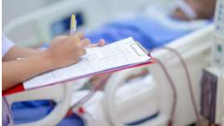
Imagem 1: Enfermagem em ambiente de atendimento a paciente crítico