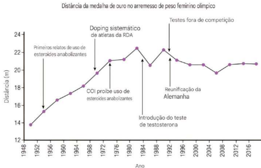
Figura 2: Trajeto de proibições de substâncias pela WADA.

Embora o GH seja proibido pela WADA como citado anteriormente no Quadro 1 e mesmo com sua trajetória nas proibições de hormônios moduladores metabólicos (Figura 2), não existem métodos de detecção que diferenciam o GH recombinante de todas as suas possíveis formas de aplicação, sua identificação ainda apresenta desafios devido à meia-vida da substância e à variabilidade na secreção por via endógena (VLAD et al., 2018; HOLT, HO, 2018).