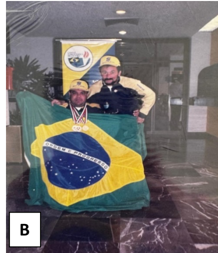
B) medalhas conquistadas em competição