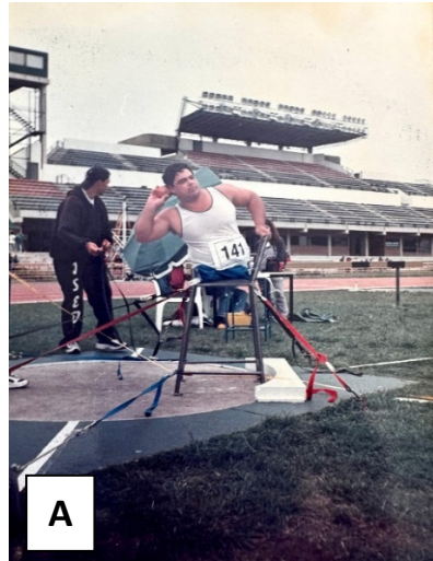
A) arremesso de peso