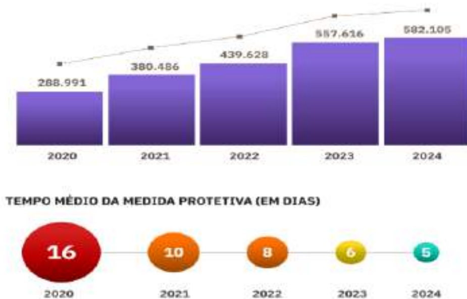
Figura 2 - Medidas protetivas concedidas

A quantidade de medidas protetivas solicitadas também foi expressiva (Figura 2), como pode ser observado: